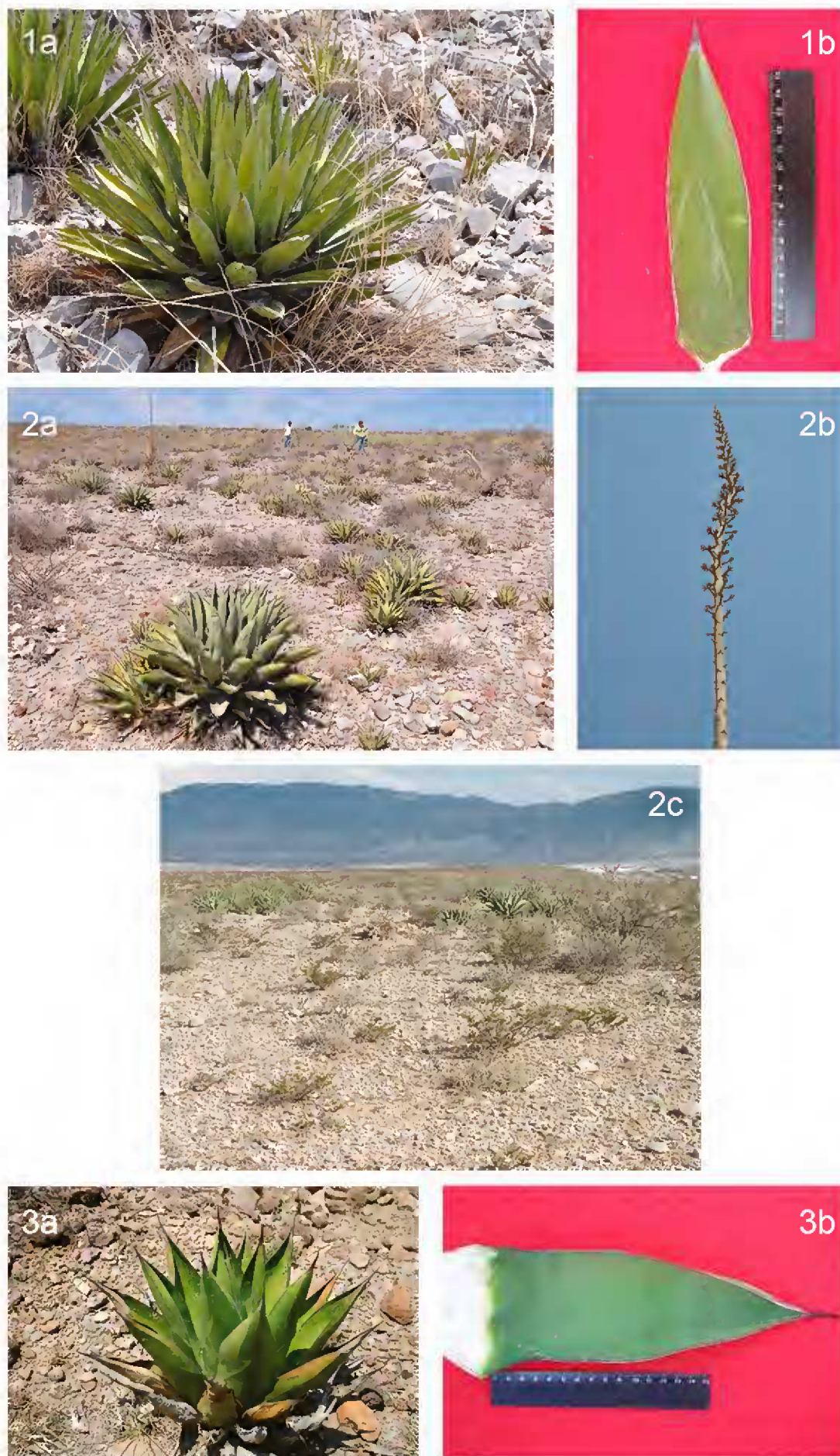
Fig. 6. Híbridos: 1a. A. nickelsiae x A. lechuguilla , 1b. hoja de A. nickelsiae x A. lechuguilla ; 2a. A. nickelsiae x A. asperrima , 2b. infrutescencia de A. nickelsiae x A. asperrima , 2c. colonia de A. nickelsiae x A. asperrima ; 3a. A. pintilla x A. salmiana , 3b. hoja de A. pintilla x A. salmiana .